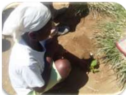
Education à l'environnement dans les écoles de Belle-Fontaine et Nouvelle-Touraine