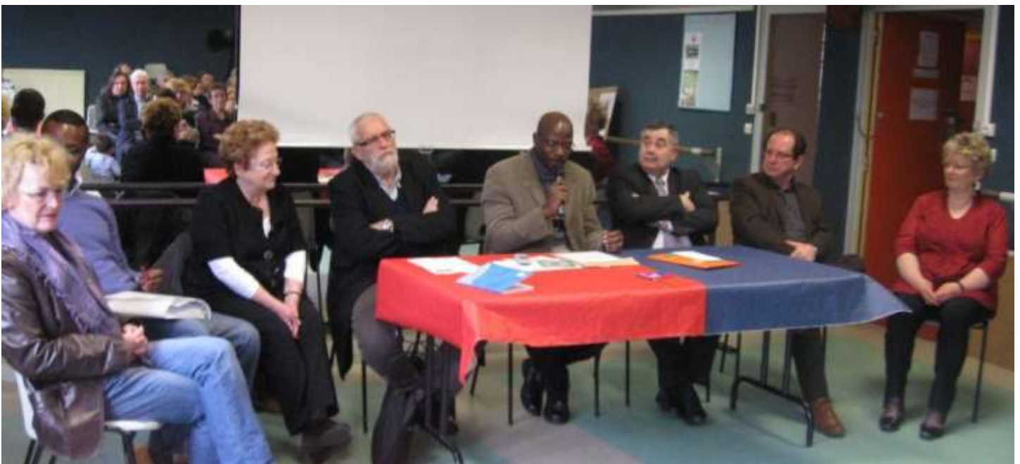
Présentation publique du premier bilan de la mobilisation en présence des partenaires et amis du GAFE le 27 février 2010 à l'Espace Pyramide d'Alençon