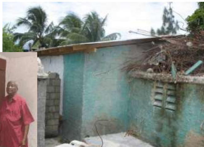
Etat de la maison de la famille LOUIS après la pose de feuilles de tôles.