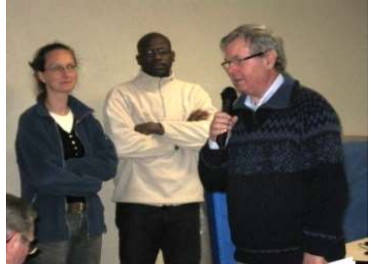
Le maire de Gesnes-le-Gandelin introduit la conférence du 02 février 2010