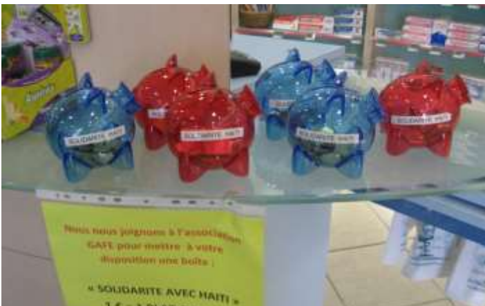
Les commerçants se mobilisent pour les actions du GAFE en Haïti