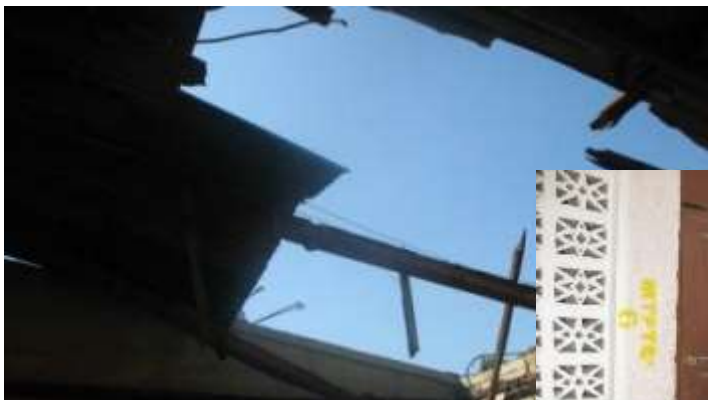
Ci-dessus: Toiture de la maison de la famille LOUIS, à Cité Militaire avant les travaux de réhabilitation