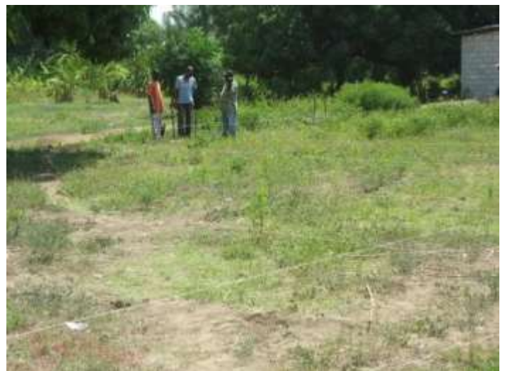
Finalisation de la phase d'implantation pour le début des fouilles