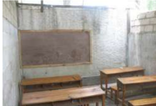
L'appui du GAFE a permis l'installation de tableaux et la réparation de la toiture de l'Institution mixte Les Frères Tinord