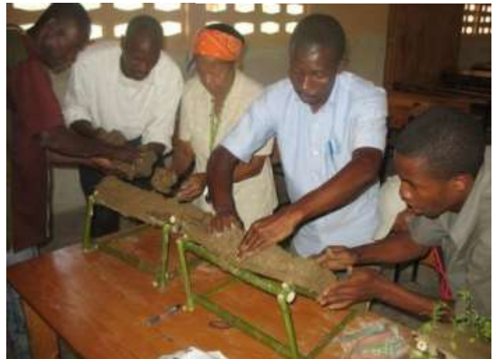
Fabrication d'une maquette de bassin versant