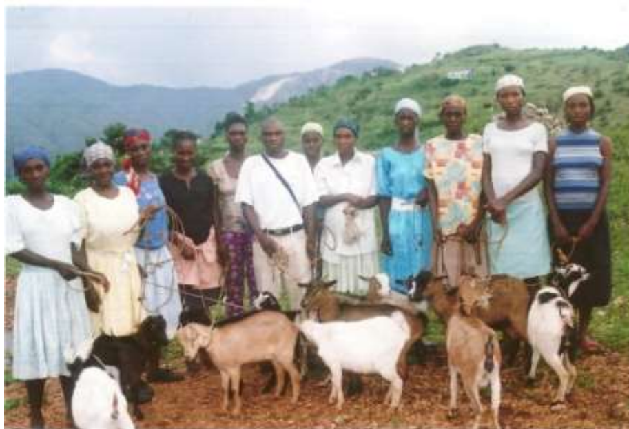
Les habitants de Belle-Fontaine avec les cabris et les moulins.

D'après le plan de développement local de la commune de Kenscoff, il était prévu l'installation d'un moulin à pistache et un moulin à maïs sur la section communale de Belle-Fontaine. Après plusieurs rencontres avec les autorités locales et le comité local de coordination, le GAFE a décidé d'octroyer une aide de 971 USD pour l'achat de 12 moulins et 12 cabris. Cette action entre dans le programme de solidarité avec les victimes du tremblement de terre et contribue par la même à renforcer la sécurité alimentaire de l'une des zones les plus reculées de Kenscoff.