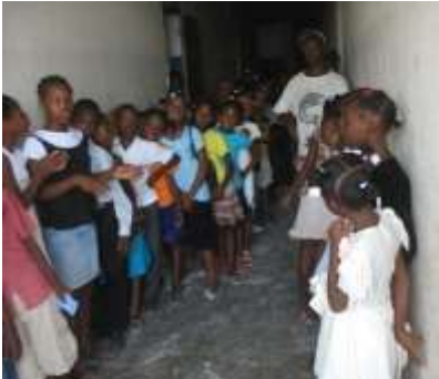
L'école a repris à l'Institution mixte de Jacquet