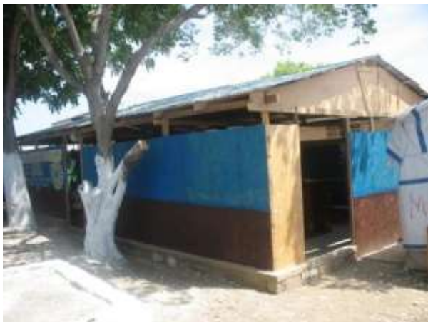
L'école mixte juvénile d'Arcachon s'est dotée d'une structure qui permettra d'accueillir 500 enfants (en plusieurs rotations) à partir de la prochaine rentrée scolaire