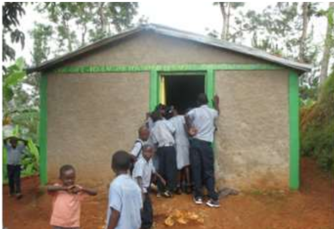
Les enfants, par l'odeur alléchés, attendent les petits pains tout chauds!