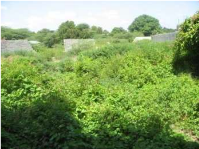
Vue du site avant travaux

Le projet a débuté le 1er août et prendra fin au plus tard le 10 octobre 2010, avant la rentrée scolaire. Le budget global s'élève à 108.346 euros, il comprend la construction du bâtiment ainsi qu'un programme d'éducation à l'environnement et l'aménagement de la cour.