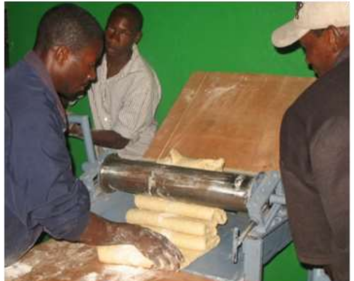
L'artisan boulanger et son apprenti en formation