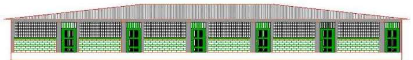
Plan de la façade de l'école de La Trembley 7