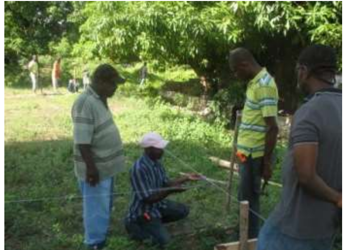
Commencement des travaux avec la phase d'implantation