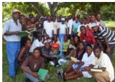
Travaux pratiques des groupes organisés avec la presse à Jatropa