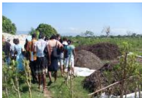
Visite du centre de valorisation des déchets de Cité Soleil