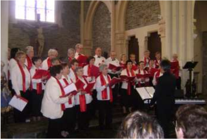
L'école de musique de Corlay (Côtes d'Armor) donne un concert en l'église du Plussulien au profit du GAFE