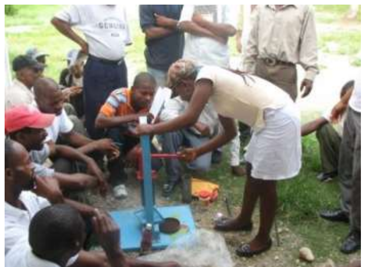
Démonstration de l'utilisation de la presse manuelle à Jatropha