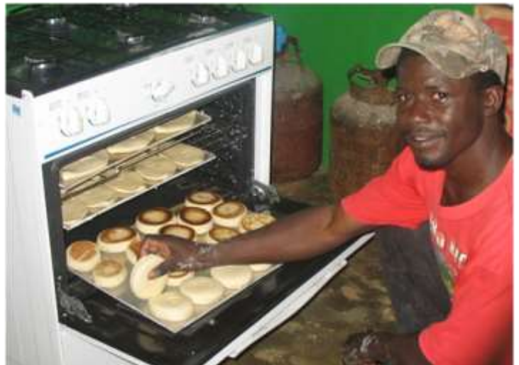
De délicieux petits pains au goût de brioche!