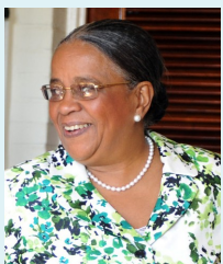
Madame Mirlande Hyppolite Manigat Professeure de Droit Constitutionnel à l'Université Quisqueya, Secrétaire générale et membre fondateur du Ras- semblement des Démocrates Nationaux Pro- gressistes (RNDP)