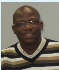
Expert international en ingénierie du dévelop- pement local Président du Groupe d'Action Francophone pour l'Environnement (GAFE)