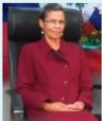
Madame Florence Elie Protectrice du citoyen Office de Protection du Citoyen d'Haïti (OPC)