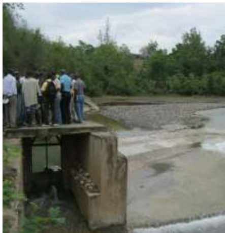
Table sectorielle délocalisée à Gros Morne: Visite de terrain

➤ La réception définitive de 17 actions en 'konbits' (travaux communautaires) et le lancement de 10 nouvelles actions gérées en direct par les micro comités.