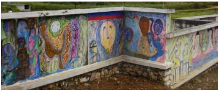
Fresque murale, Mouvement Saint-Soleil, Soisson-la-Montagne

En effet, Kenscoff est une commune renommée pour sa production artistique, notamment à travers les artistes du mouvement Saint-Soleil de Soisson-la-Montagne.