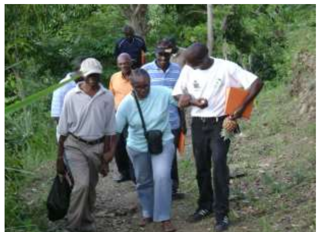
Visite du musée végétal à Vallue

➤ 3 jours de visite pour 60 acteurs du bassin-versant Ennery-Quinte à Vallue (Petit-Goâve). Les paysans de l'Associations des Paysans de Vallue (APV) ont pu échanger et partager leur expérience avec les représentants de l'AIBVEQ en matière