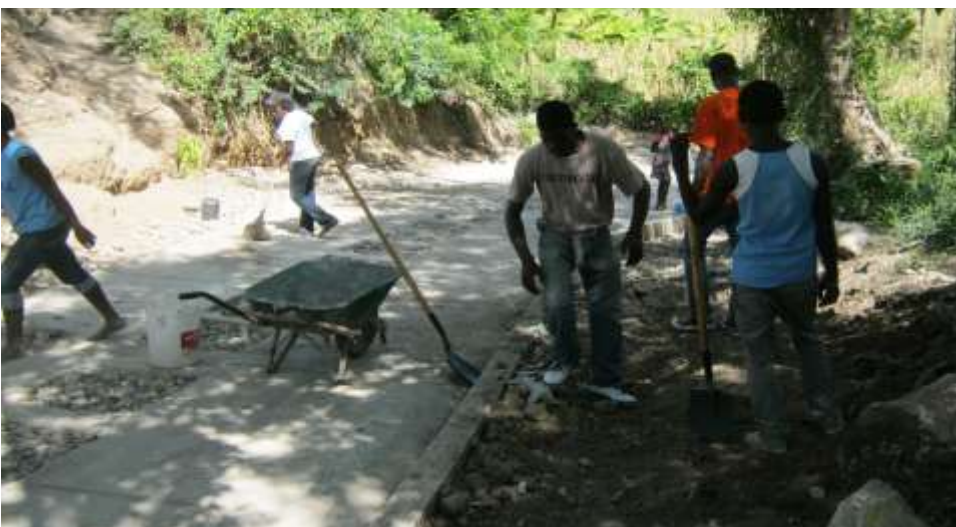
Concours dans les lycées

œuvre d'une action de développement local d'un montant de 2 500