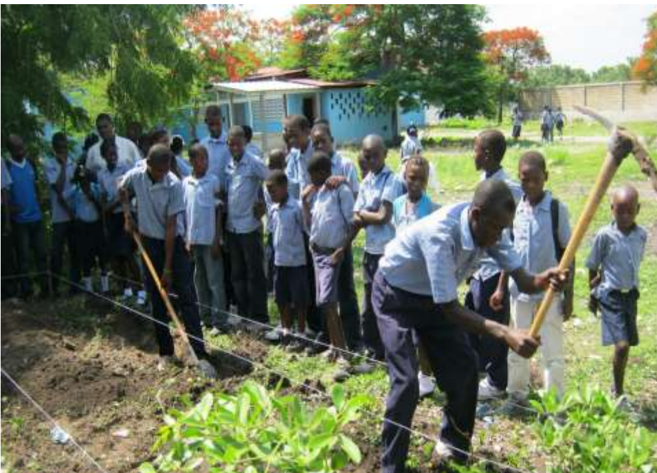
Concours dans les écoles