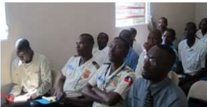
Formation des élus locaux et des policiers de Kenscoff