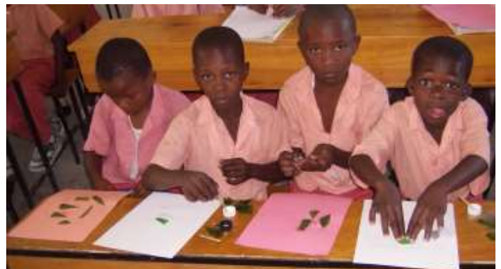
Atelier de recyclage des bouteilles en plastique

Pendant trois mois les enfants de l'IMJH ont pratiqué des activités autour du recyclage (compost, fabrication de bijoux, papier recyclé...) et préparé une exposition publique de leurs œuvres.