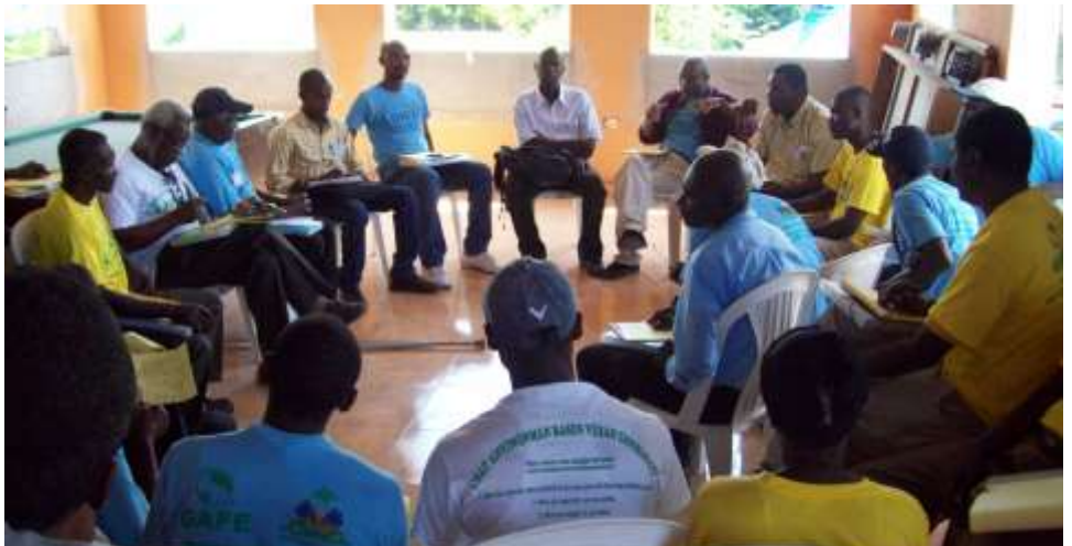
Deuxième Rencontre Intercommunale: Atelier sur les missions du comité de bassin-versant l'AIBVEQ.

Deuxième Rencontre Intercommunale pour la protection du bassin-versant Ennery Quinte, du 10 au 16 mai 2012 à Gonaïves :