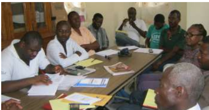
Rencontre du bureau exécutif de l'PAIBVEQ