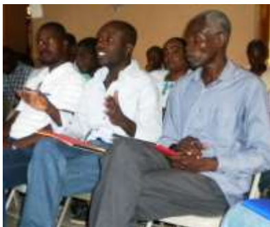
Formation des acteurs du bassin-versant sur le dynamisme institutionnel