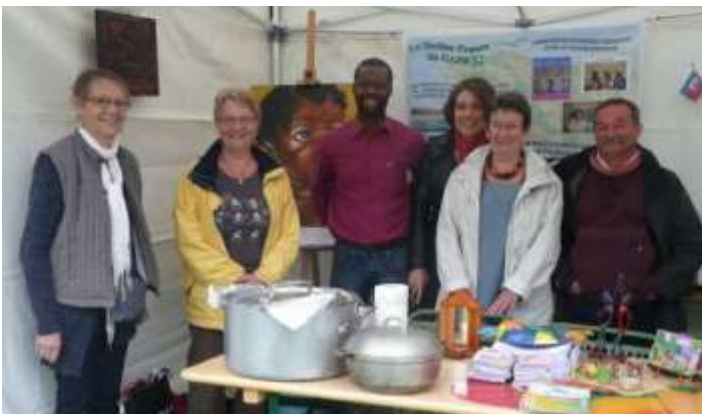
Les membres de la Section France toujours mobilisés!