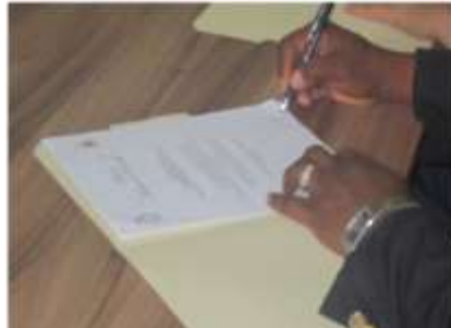
Signature des contrats