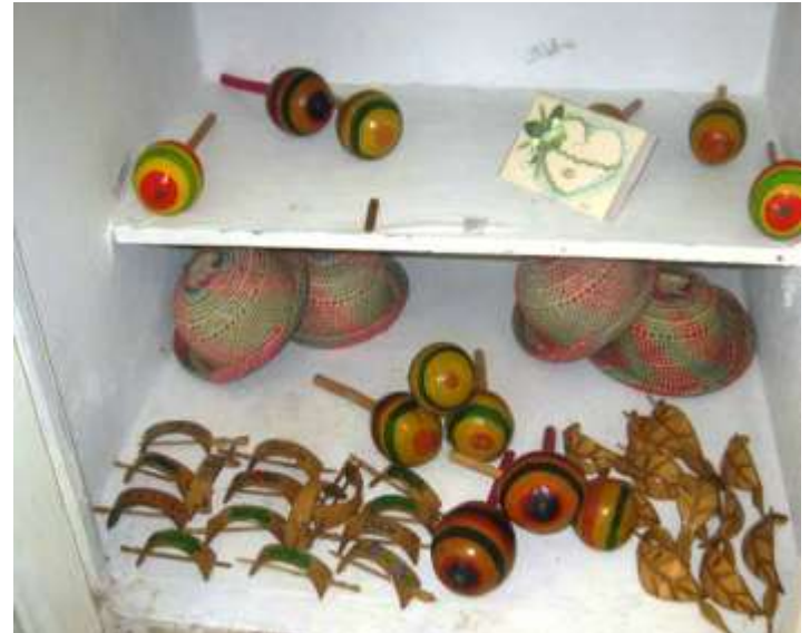
Artisanat exposé au CICK