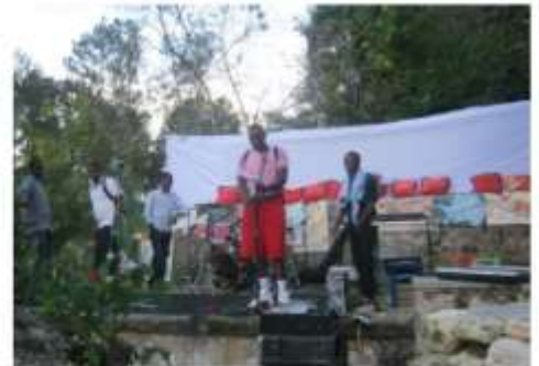
Back to School 2011