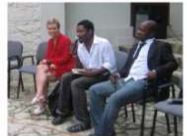
Les Passagers du Vent