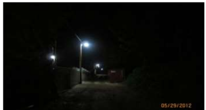
Electrification de la route Mevs

La route est éclairée après plus de 25 ans d'absence d'électricité ! Ces travaux ont permis d'ouvrir des perspectives pour les résidents des routes transversales. C'est aussi une opportunité pour électrifier la