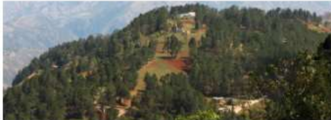
Vue panoramique de Kenscoff