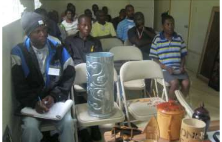
Formation sur la commercialisation des œuvres

Un circuit des ateliers d'artistes et artisans d'art de Kenscoff sera aussi créé dans le but de faciliter leur accès au public. A l'image d'un jeu ludique, les touristes seront invités à choisir parmi les parcours artistiques et artisanaux proposés par l'office de tourisme de Kenscoff.