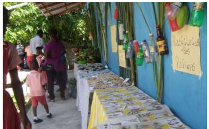
Exposition des pièces d'artisanat produites par les enfants