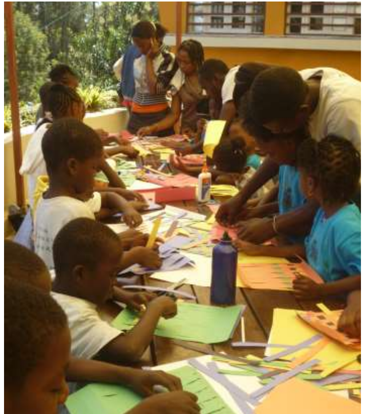
Atelier de fabrication de valisettes en papier

Pour la première fois, toutes les unités ont organisé, ensemble un Camp d'Été pour les enfants de Kenscoff en août 2012. Le succès de l'activité renforce la conviction de l'équipe du CICK du bien-fondé du projet et de l'utilité du CICK au sein de la communauté.