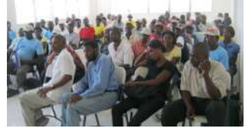
Présentation des konbits