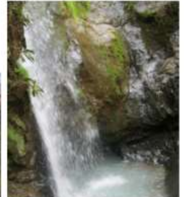
Bassin bleu, Furcy