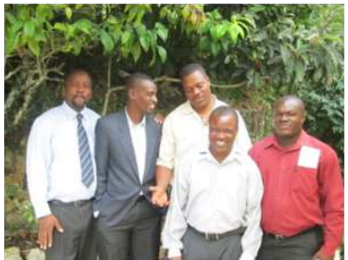
De gauche à droite, les maires adjoints de la nouvelle commission, le maire titulaire et les adjoints de l'ancien cartel

En effet, notons que les recherches pour la mise en place d'un plan de développement ont été entamées en 2004 par un cartel, que la mise en œuvre du plan a été réalisée par un autre cartel, et que le CGC du 2 août 2012 s'est déroulé dans le cadre d'une meilleure harmonisation des actions du présent projet tiré du PDLK, commencé avec l'ancienne équipe municipale et qui se poursuit avec la nouvelle commission!