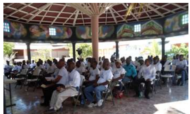
Les élus d'Anse-Rouge et Terre-Neuve mobilisés autour du GRAPES

Plus de 100 élus étaient présents pour entendre parler de développement local et de planification territoriale. Et les plus sceptiques et hostiles d'entre eux se sont finalement accordés sur la nécessité de collaborer pour l'avancement des territoires sans attendre systématiquement une aide extérieure.