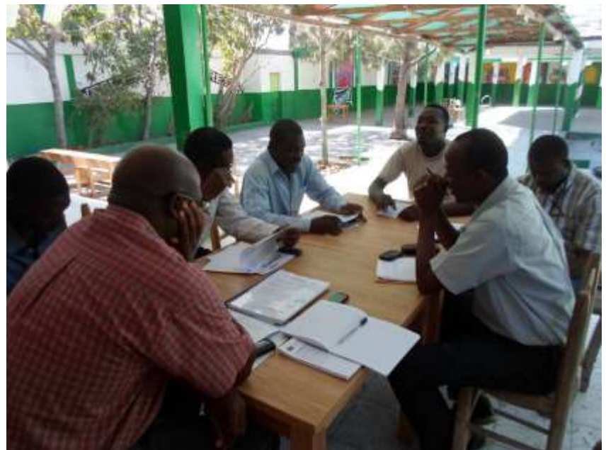
Réunion de planification avec l'équipe municipale le 16 janvier 2014

La première étape était la présentation de l'action auprès de l'équipe municipale puis le lancement officiel devant un panel d'invités. La cérémonie s'est déroulée le 17 janvier 2014 à Desdunes en présence d'une centaine d'invités. De son côté l'équipe municipale se montre très motivée et disponible, ce qui augure l'avenir sous de bons présages!