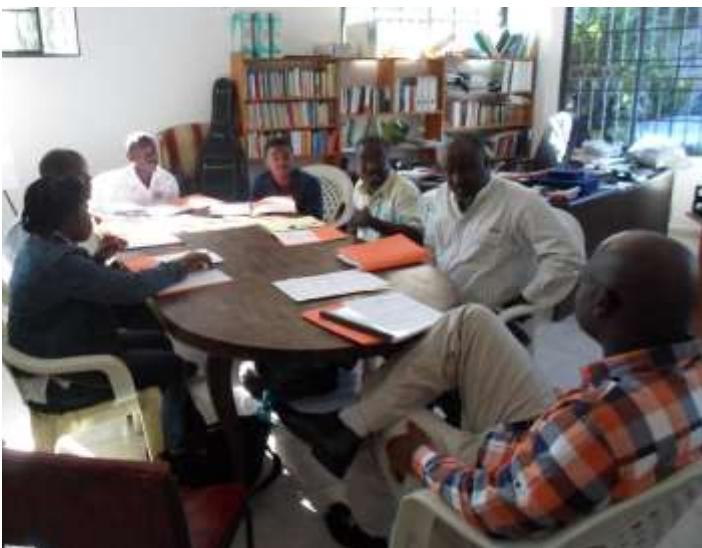
Séance de formation au bureau du GAFE à Fermathe avec les membres du GRAPES

Ainsi donc les 08 et 09 novembre 2013, une délégation de 11 personnes du GRAPES a été accueillie au Centre d'Initiatives Communal de Kenscoff pour une formation sur le développement local, le tourisme et la vie associative. Puis, du 10 au 12 décembre 2013, 6 membres du GRAPES ont participé au bureau du GAFE à une formation sur mesure et très pratique. L'objectif de ce séminaire est de permettre au GRAPES de soumettre une offre au prochain appel à proposition de l'Union européenne en se basant sur les annexes même dudit appel à proposition.