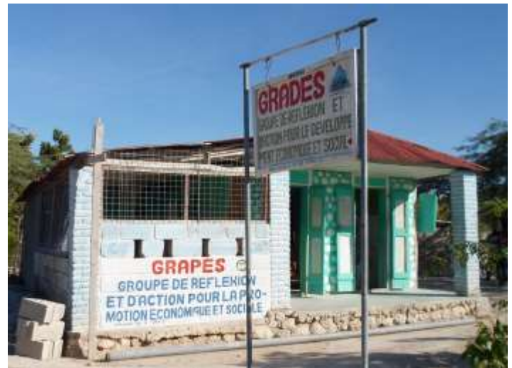
Les locaux du GRAPES, à Figuier (Anse-Rouge, Artibonite)

Enfin les 06 et 07 décembre 2013, c'était au tour de l'équipe du GAFE de se rendre à Terre-Neuve et Anse-Rouge.