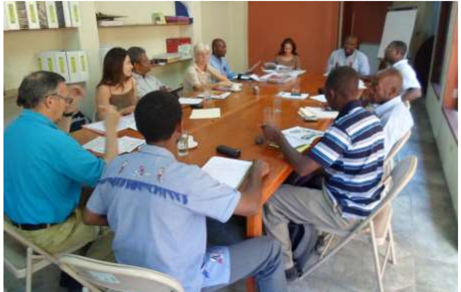
Un atelier de réflexion avec les représentants d'organisations haïtiennes, partenaires de la PFHS ou de l'un de ses membres et d'organisations suisses en Haïti

Le 08 janvier 2014, le GAFE s'est vu confier par la Plate-Forme Haïti de Suisse, l'animation d'un atelier de réflexion sur l'impact du contexte sur les activités des partenaires, leur perception des activités de la PFHS en Haïti et les perspectives. L'atelier s'est déroulé dans