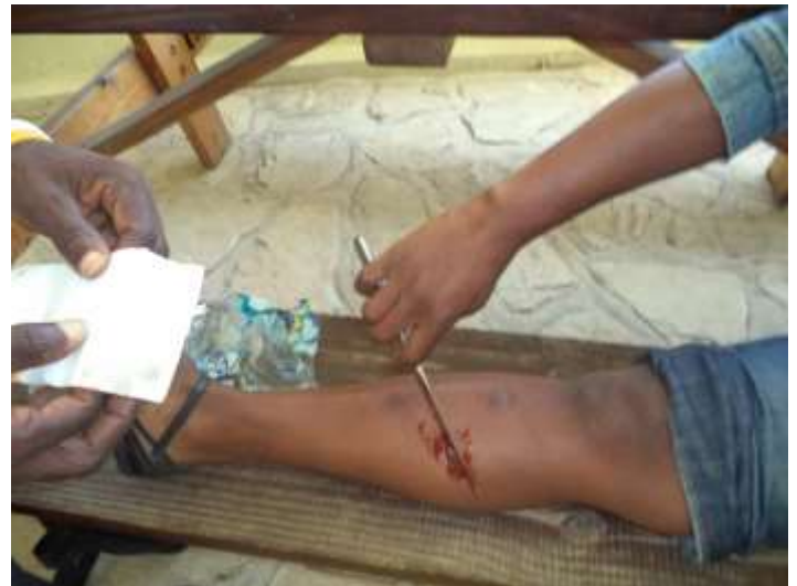
Ame sensible, s'abstenir!

isations de femmes de Kenscoff la place qui leur revient de droit, avant la fin du mois de février 2015, le GAFE animera une rencontre intercommunale sur les droits de la femme et la place de la femme en politique.