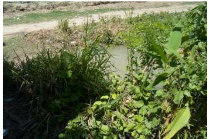
Vue du canal de la ferme des 3 bornes