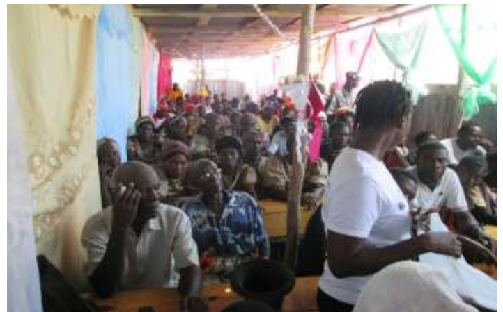
Réunion publique de Modèle