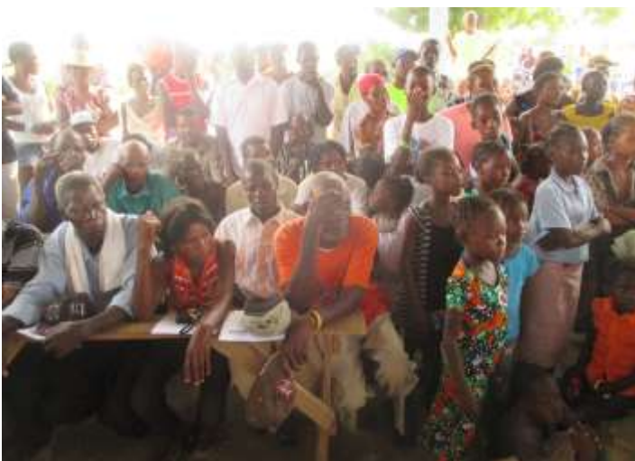
Réunion publique de Grand-Islet