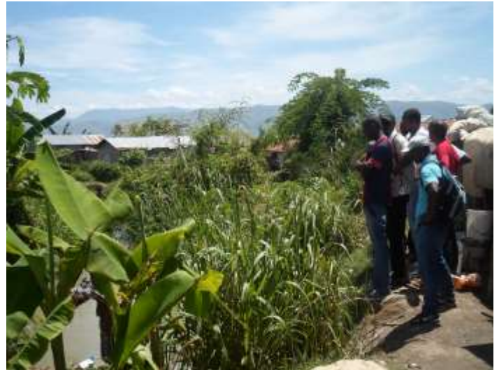
Les CASEC découvrent le site