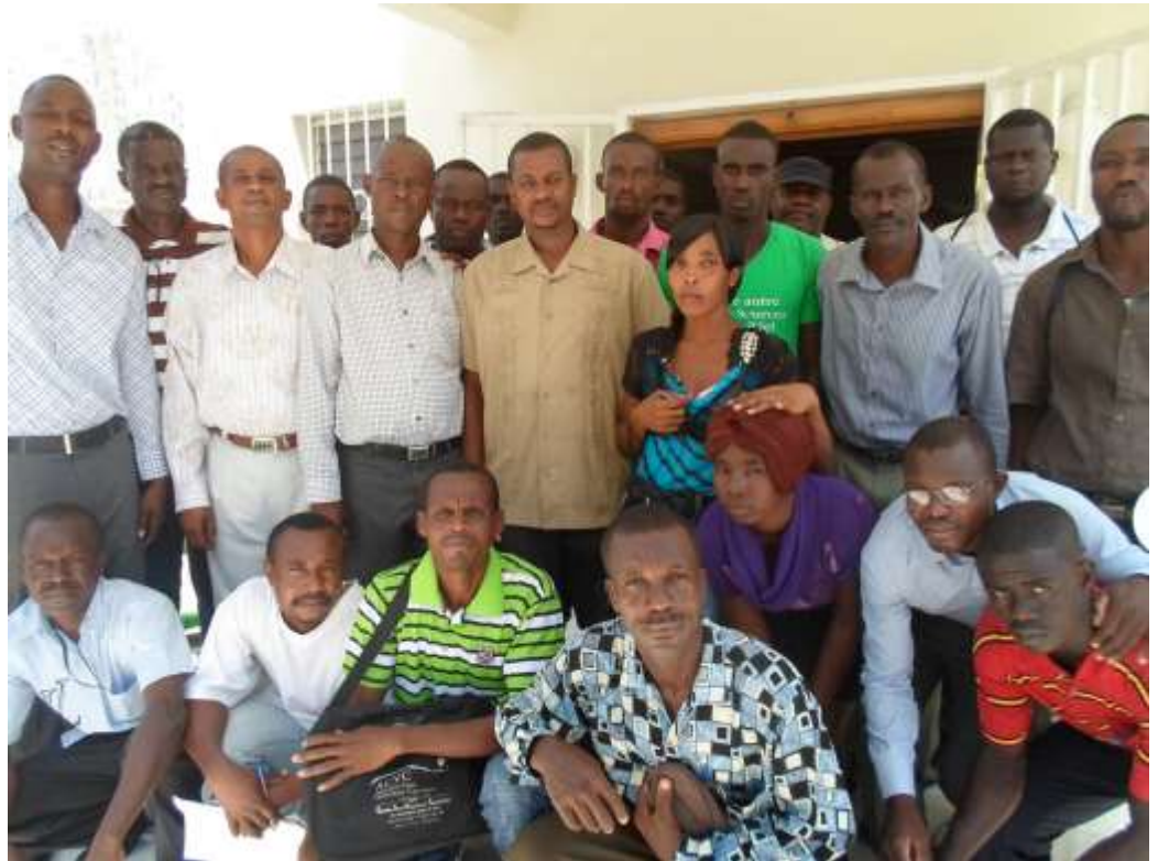
Le comité de gestion communal

Les réunions publiques font partie des outils de communication et d'animation territoriales prévus dans le projet. Ainsi, du 12 au 30 juin 2014 une série de rencontres publiques allaient s'organiser sur toute la commune de Desdunes. Ces rencontres sont l'occasion pour les CLC d'informer, d'expliquer à la population ce qu'ils font exactement. C'est également l'occasion pour la population de rencontrer les CLC, de poser des questions, de discuter, de s'exprimer. Pour réaliser ces grands rassemblements, les CLC ont eu à gérer et justifier un budget. Ces réunions ont été un exercice grandeur nature de programmation, de planification, d'exécution et de rédaction d'un rapport financier et narratif.