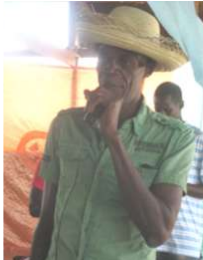
Réunion publique de la Hatte- Desdunes: un espace ouvert aux citoyens