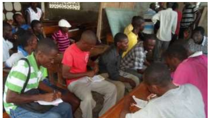
Inscription des candidats, Duclos

Au-delà de l'action, c'est le CGC qui sera responsable de la mise en œuvre du plan communal de développement (PCD). Le CGC est une structure mixte composée d'élus locaux, de représentants de la société civile, du secteur privé et de la police.