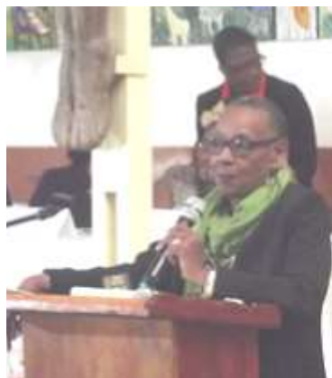
Mme Mireille Zamor représentante du Ministère à la condition féminine et aux droits de la femme