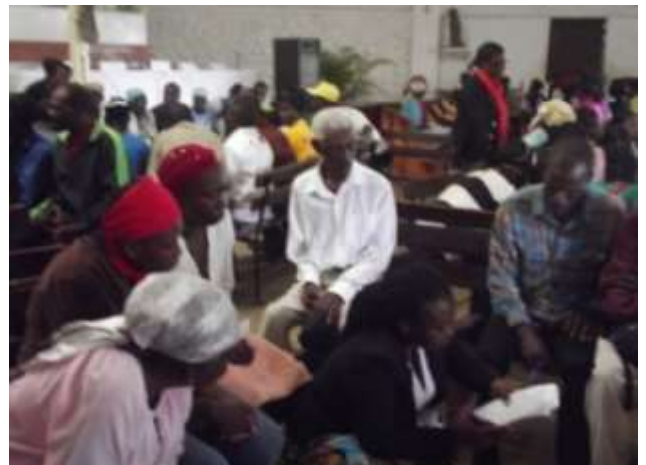
Travaux en ateliers