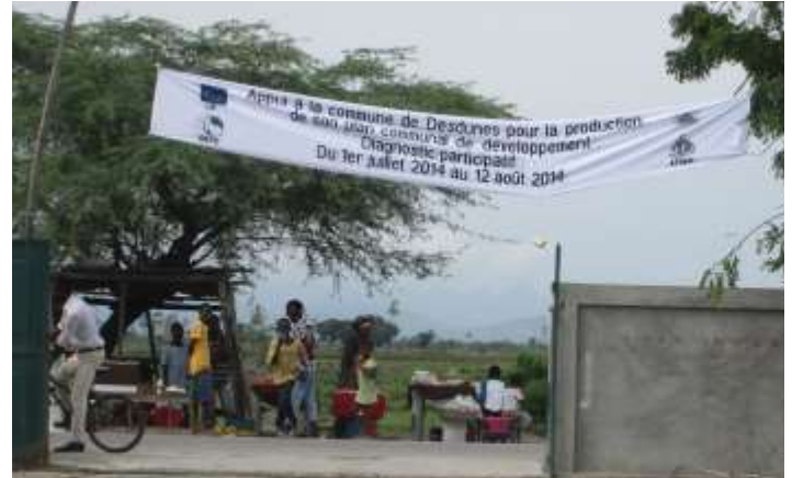
Le diagnostic a été largement annoncé sur la commune: bande- roles, radio, affichage, reunions publiques...

au 12 août 2014. Chaque enquêteur devait remplir 250 formulaires, pour un total de 4 500 à traiter. Ce qui représente un échantillon de 13% de la population totale de Desdunes.