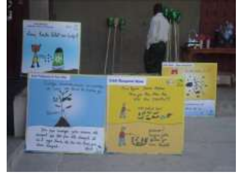
Affiches produites par les écoles