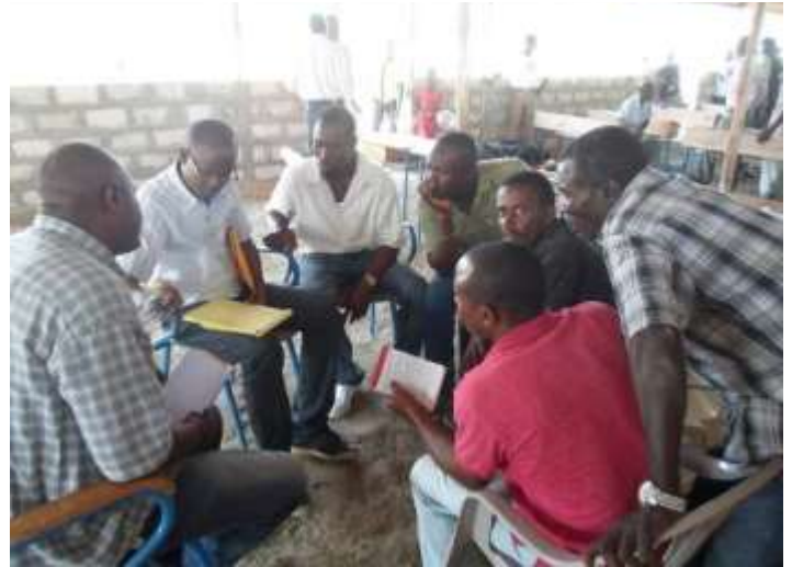
Bureau électoral, Hatte-Desdunes

Le CGC, au niveau communal, est chargé de la définition de la politique de développement communal, du suivi et de l'évaluation de l'action.