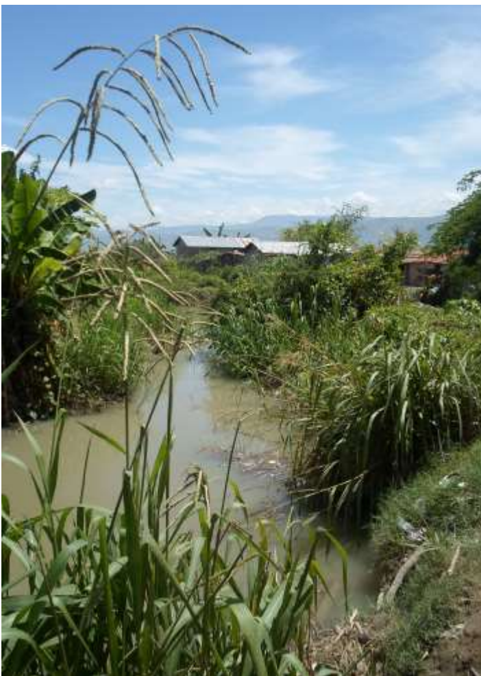
Le point de départ des travaux

Dans un premier temps, l'Ingénieur superviseur est chargé de préparer un dossier d'appel d'offres pour recruter la firme qui réalisera les travaux.