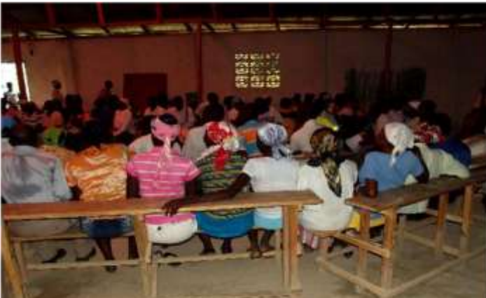
Les femmes de Belle-Fontaine

En définitive ce deuxième débat aura été d'une utilité énorme pour toutes les femmes, mais surtout les familles, de comprendre l'importance de cerner et de discerner grâce aux témoignages des intervenants, aux discussions en atelier, qu'elles ne doivent plus se laisser faire même si c'est leur mari. Qu'elles doivent mieux éduquer leurs enfants surtout leurs fils pour qu'ils apprennent à respecter les femmes et concourir à une société meilleure et équilibrée.