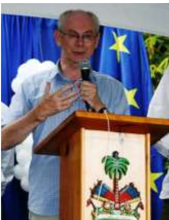
Herman Van Rompuy, UE

« Kenscoff est la seule commune du pays où toutes les sections communales sont dotées de bureaux pour les élus », s'est-elle félicitée, s'engageant à continuer sur la voie tracée par l'ancien cartel. «Nous sommes reconnaissants de ce que vous avez fait avec nos fonds», a rétorqué Herman Van Rompuy avant de recevoir une gerbe de fleurs des mains de l'agent exécutif intérimaire de Kenscoff. Nous sommes heureux de pouvoir soutenir des initiatives locales».