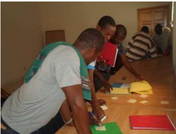
Rédaction collective d'un poème sur l'environnement à partir d'une liste de mots inspirés par des photos

Durant l'été les 18 enquêteurs ont sillonné la commune de Desdunes. Chacun a rempli ses 250 fiches sous la supervision des CLC.