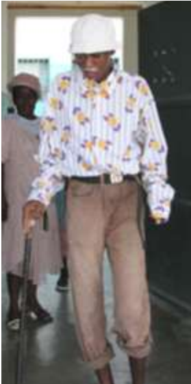
Lagon Penyen: pépinière de talents!