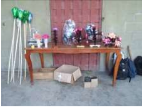
Exposition des œuvres des élèves à partir de bouteilles plastique