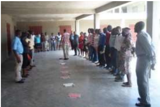
Jeu de Poie

Dans un premier temps, les participants ont eu à exprimer leur relation au milieu naturel à travers différentes activités ludiques.