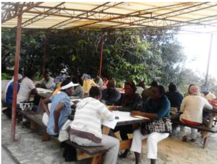
Travaux en atelier sur le thème du pouvoir

Dans le même temps les femmes de Kenscoff seront invitées à marcher pour revendiquer leurs droits et une foire-exposition sera organisée.