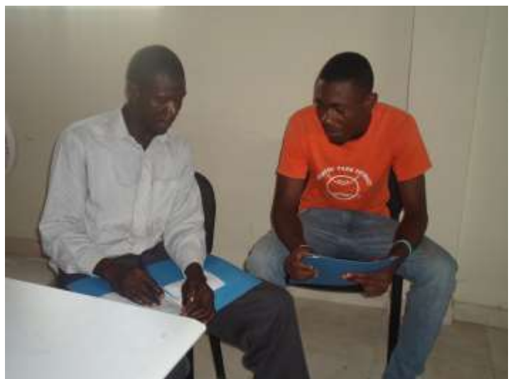
2 stagiaires en plein exercice de simulation

Le diagnostic participatif se fait sur la base d'un formulaire proposé par le GAFE et validé par le CGC. La collecte des données s'est faite en porte-à-porte pendant 1,5 mois par 18 enquêteurs formés, du 1er juillet