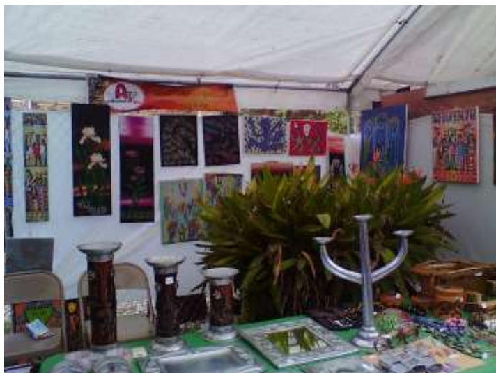
Stand des artistes et artisans d'art de Kenscoff (KAAK)

Le CICK a participé les 20 et 21 octobre 2012 à l'évènement