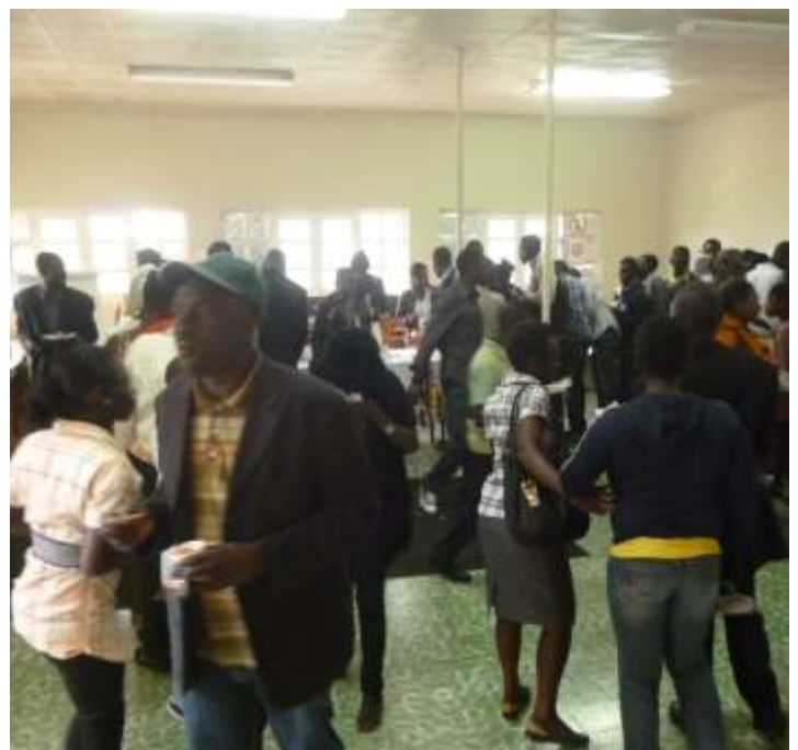
Les amis du CICK autour du verre de l'amitié