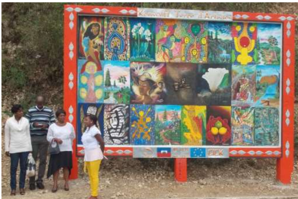
Cérémonie d'inauguration de la fresque sur la route de Kenscoff le 16 mars 2013

La fresque est terminée depuis le samedi 2 février 2013. Elle a été inaugurée le 16 mars 2013 à l'occasion du deuxième anniversaire du CICK.