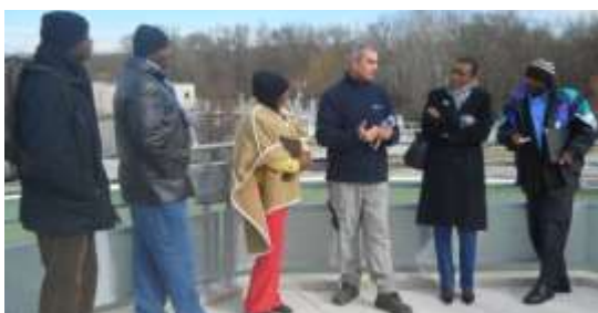
Visite de la station d'épuration Les Entrages