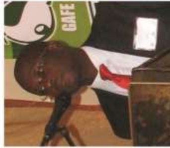
Willy Jean-Baptiste Sénateur de l'Arbonite