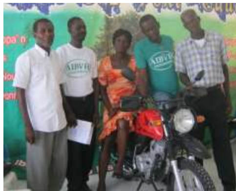
L'équipe du comité de Badon-Marchand reçoit le premier prix: une motocyclette et accessoires.

Le 1 er prix a été attribué au comité micro-bassin de Badon-Marchand qui a reçu une motocyclette et accessoires. Le 2 ème prix, Centre-Ville Ennery : une pompe, 5 brouettes, 24 machettes, 24 houes, 5 paires de bottes. Le 3 ème prix, Bras-à-Gauche : moulin à moteur à pistaches, 2 brouettes, 2 pelles, 2 râpeaux, 12 houes, 12 machettes, 2 paires de bottes. Et un prix spécial, Sedrenn : moulin à moteur à pistaches, 2 brouettes, 2 pelles, 2 râpeaux, 12 houes, 12 machettes, 2 paires