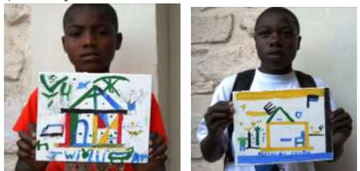
Deux jeunes de moins de 20 ayant participé à la première partie du concours et ayant remis leurs œuvres

Activité 2 : Organisation d'un concours artistique pour les jeunes de moins de 20 ans