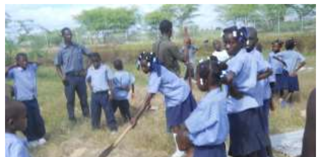
Animations d'ERE à Grand-Islet