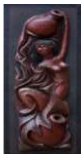
Œuvre d'art du plasticien David Thébaud