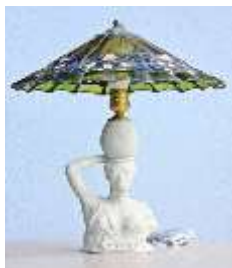
Œuvre d'art de l'artisan d'art Frank Vendryes