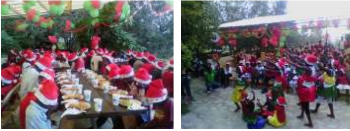
Fête de Noël pour les jeunes de la route Mevs