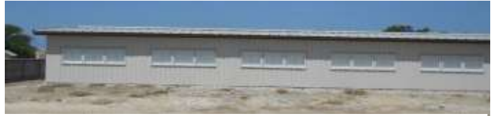
Ecole ultra-moderne de la Hatte-Desdunes

En septembre 2013, l'équipe du GAFE a visité les cinq écoles. Puis chaque école s'est engagée à suivre le programme en signant une charte d'engagement et les animations ont commencé.