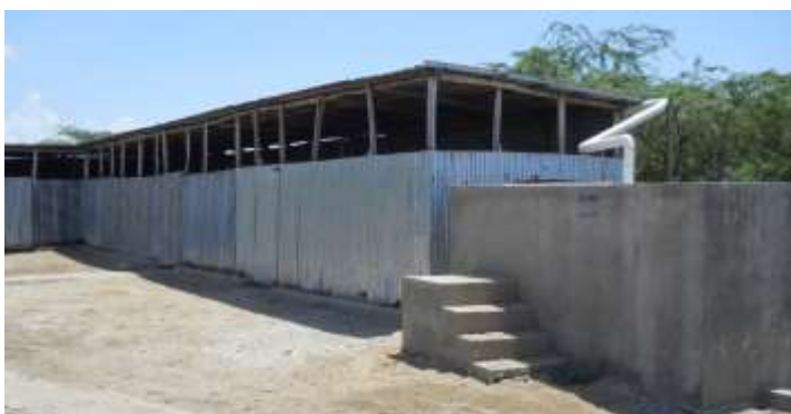
Ecole nationale de Modèle