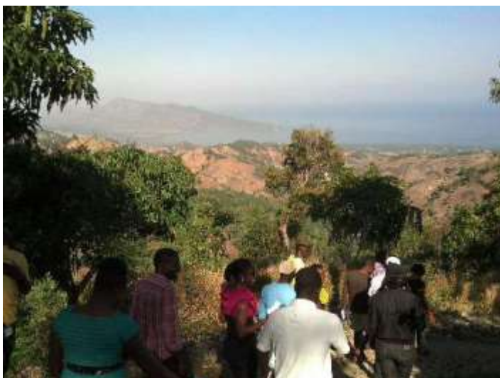
Vallue et Kenscoff, plus que des expériences à partager...