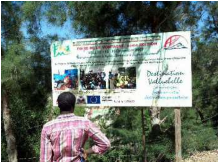
Visite de terrain à Vallue (Petit-Goëve)