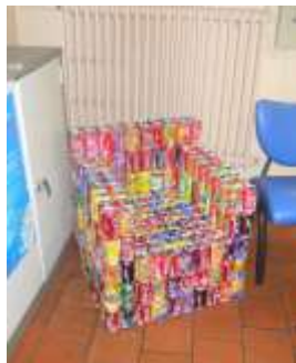
Espace de créativité