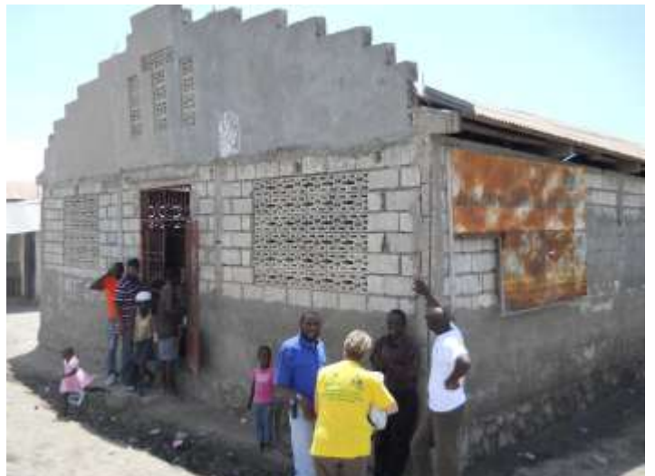
Ecole nationale de Duclos