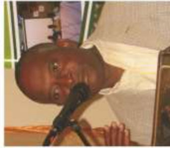
Cholzer Chancy Député d'Ennery