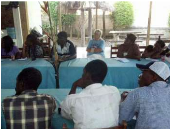
Rencontre et échanges avec les acteurs locaux