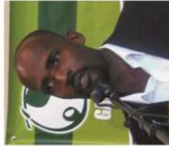
Dupner Clément Député de Baracoères/Grand Boucan