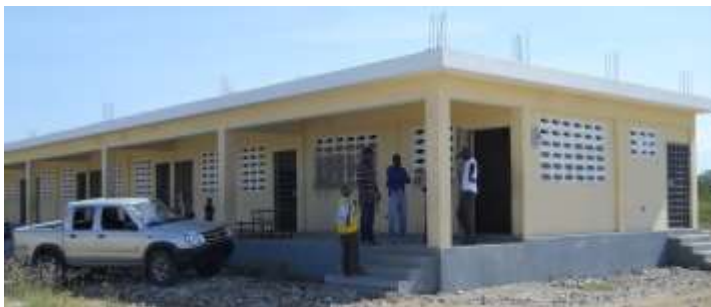
Ecole nationale Aux-Sources