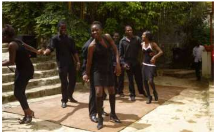
Spectacle de danse par les jeunes bénévoles du CICK

Après Salon-de-Provence, le marathon s'est poursuivi sur Paris où la délégation a rencontré les membres de la plate-forme des associations franco-haïtiennes (PAFHA), les Cités-Unies France, l'Ambassadrice d'Haïti en France, la Fondation de France. Après Paris, direction Alençon pour y prononcer une conférence avant de reprendre l'avion pour Port-au-Prince.