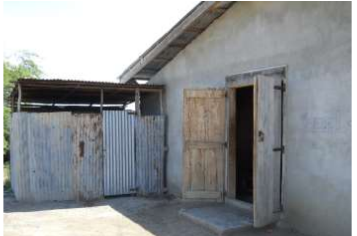
Ecole nationale de Grand-Islet