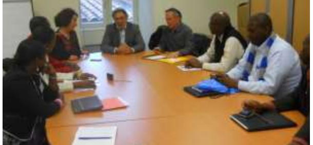
Direction générale des services de Salon-de-Provence