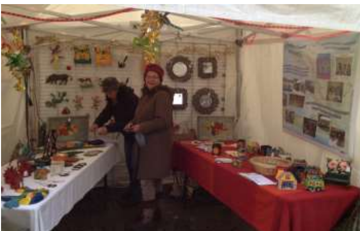
Rendez-vous incontournable: Le marché de Noël d'Alençon!