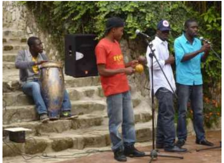
Kenscoff: une pépinière de talents