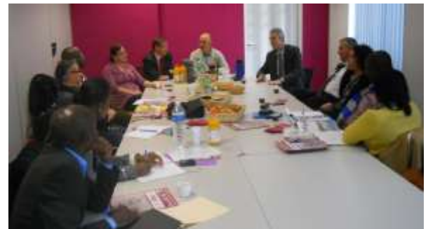
Rencontre avec les cadres techniques de l'Agglople