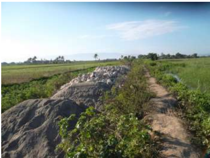
Entreposage des matériaux granulaires