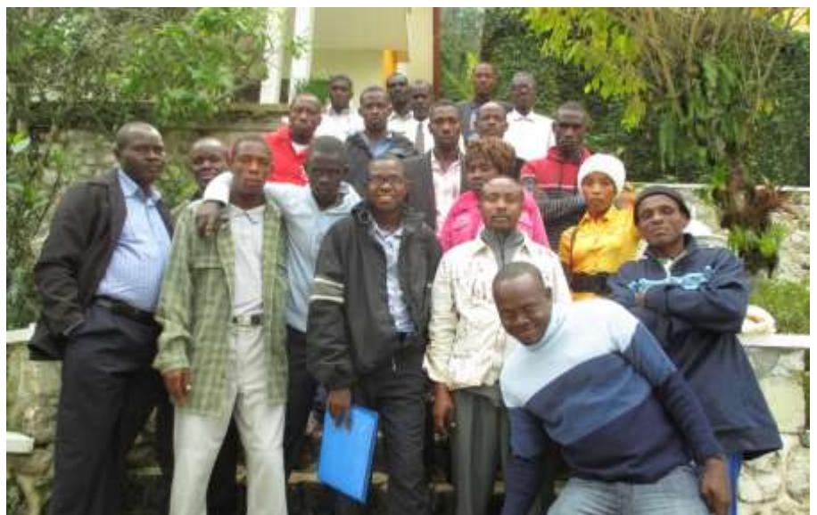
Les Desduniens ont affronté le froid de Kenscoff!