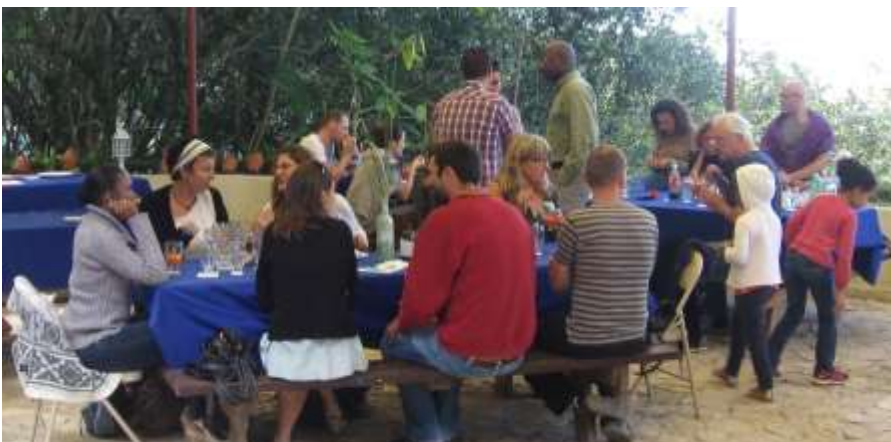
Des convives repus et contents!

Au menu du repas de l'année prochaine: pot-au-feu, alors pensez à réserver, il n'y en aura pas pour tout le monde!!!