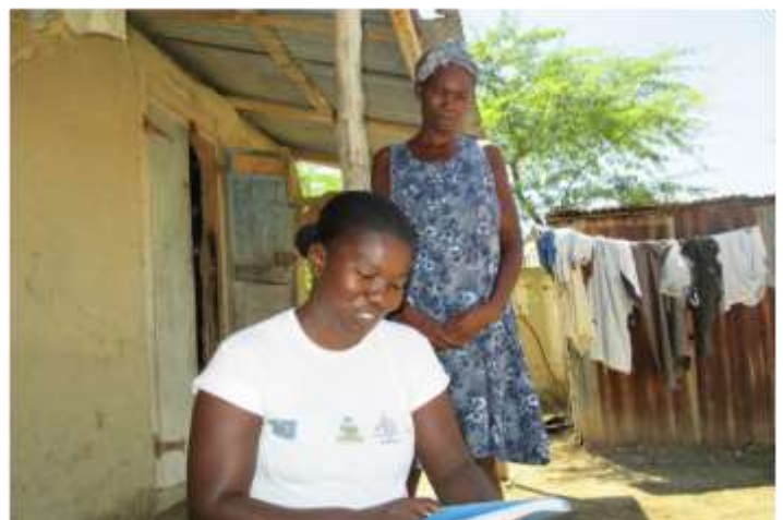
Collecte des informations auprès des habitants de Grand-Islet