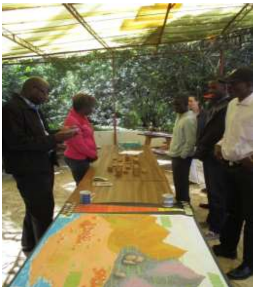
Les participants jouent Nenco.

co, le jeu imaginé par le GAFE pour mieux comprendre la stratégie des acteurs sur un territoire.