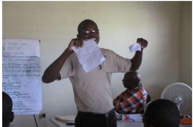
Le groupe de Jacob a organisé une marche pacifique. Il a fait passer ses revendications à travers un chant.

co, le jeu imaginé par le GAFE pour mieux comprendre la stratégie des acteurs sur un territoire.