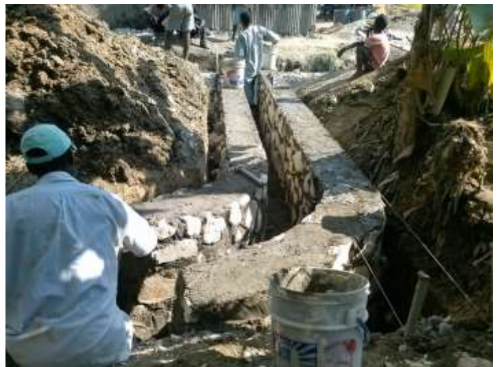
Ci-dessus: Ouvrages de régularisation