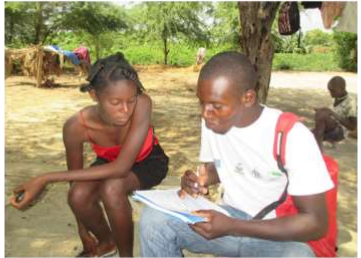
Collecte des informations auprès des habitants de Hatte-Desdunes