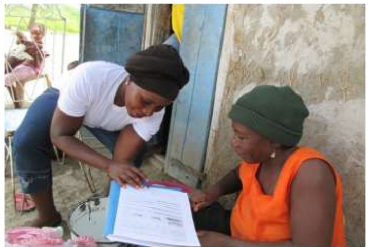
Collecte des informations auprès des habitants de Aux-Sources