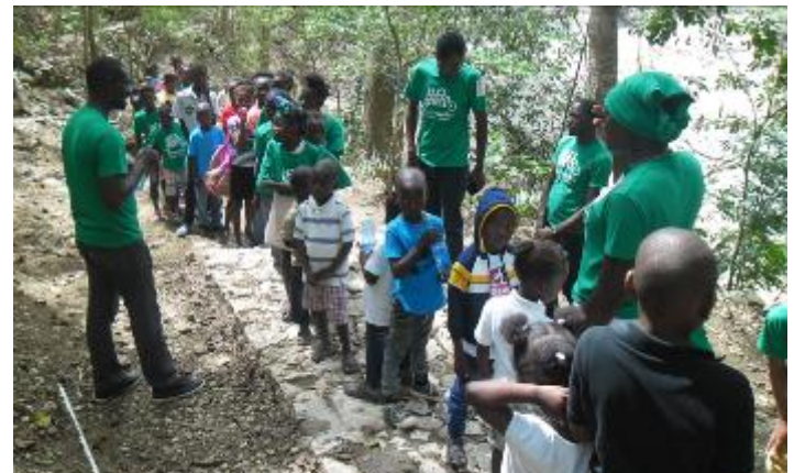
Une excursion écologique pour découvrir la richesse écologique de Bassin Zim