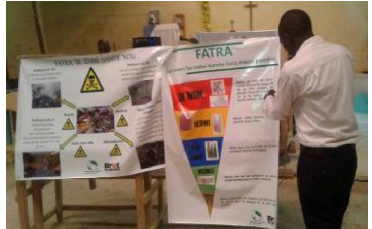
Utilisation des affiches produites à Belle-Fontaine

Après la formation, les activistes communautaires ont programmé et animé des causeries autour de la problématique des déchets dans chaque section communale, au cours de l'été 2018 avec l'appui de l'équipe du GAFE.