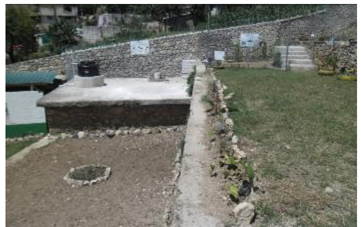
Aménagement d'une aire de compostage, d'un jardin scolaire et embellissement de la cour du CECLAC

Le bureau d'information et d'action pour l'environnement met à la disposition des élèves et des enseignant-es une large variété d'ouvrages de référence sur les thèmes liés à l'environnement, une loupe binoculaire, du mobilier, des fournitures et papeterie.