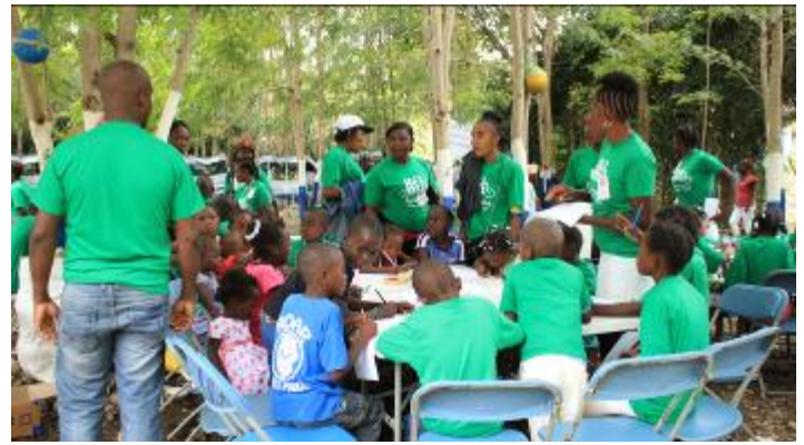
Animations environnementales pour les jeunes