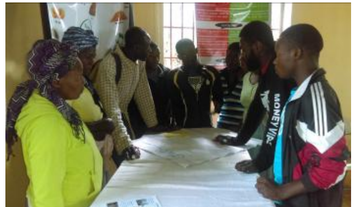
Travaux en ateliers à Sourçailles