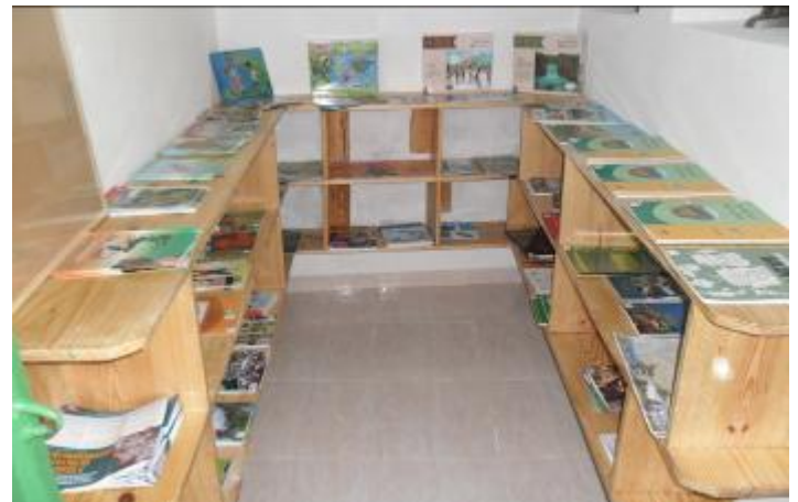
Aménagement du centre d'information et d'action pour l'environnement du CECLAC

Le bureau d'information et d'action pour l'environnement met à la disposition des élèves et des enseignant-es une large variété d'ouvrages de référence sur les thèmes liés à l'environnement, une loupe binoculaire, du mobilier, des fournitures et papeterie.