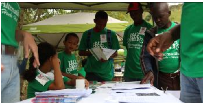
Plus de 200 signatures pour la pétition pour le bannissement total, définitif et inconditionnel du styrofoam en Haïti