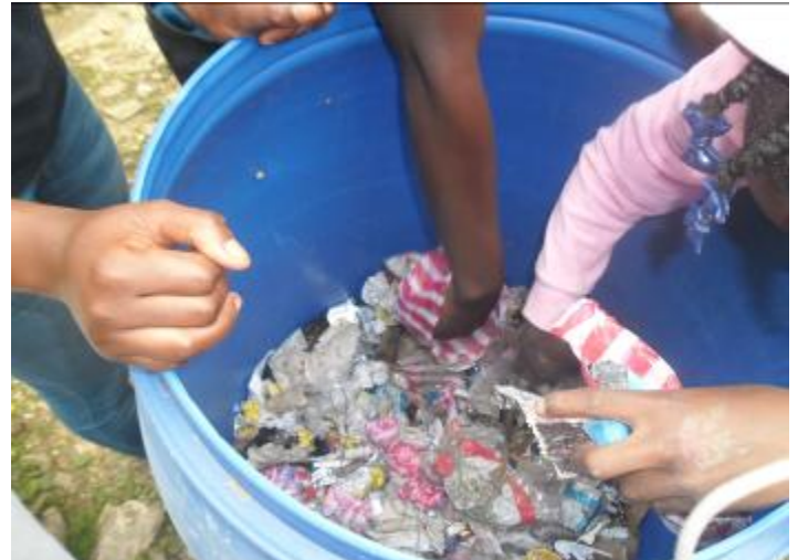
Tri des déchets par une équipe de volontaires

Pendant plusieurs jours, avec la complicité de la Direction de l'école, la cour n'a pas été nettoyée et les déchets sont restés là où ils ont atterri. Dans un deuxième temps les déchets ont été collectés et triés par une équipe volontaire. La prochaine étape sera de définir et mettre en place des alternatives pour chaque catégorie de déchets, dans la mesure du possible.