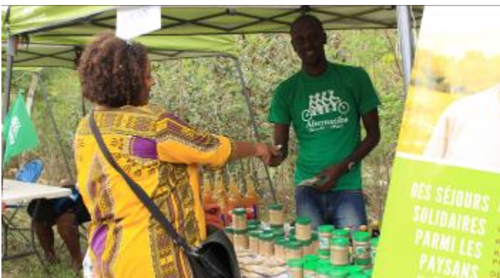
Des exposants ravis de partager leurs produits et savoir-faire