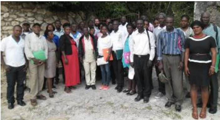
Groupe des ASEC et CASEC de Kenscoff

Elus locaux, enseignant-es et activistes communautaires ont suivi trois jours de formation sur la gestion des déchets axée sur la réduction à la source. L'occasion était trop belle pour parler du plaidoyer pour le bannissement du styrofoam sur la commune!