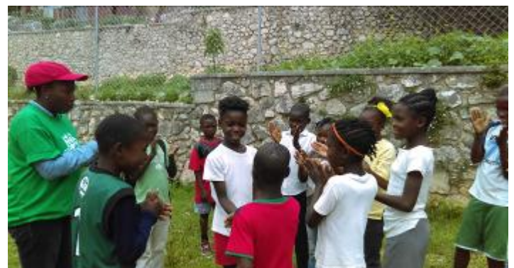
Tournoi de football, quizz, courses en sac au programme