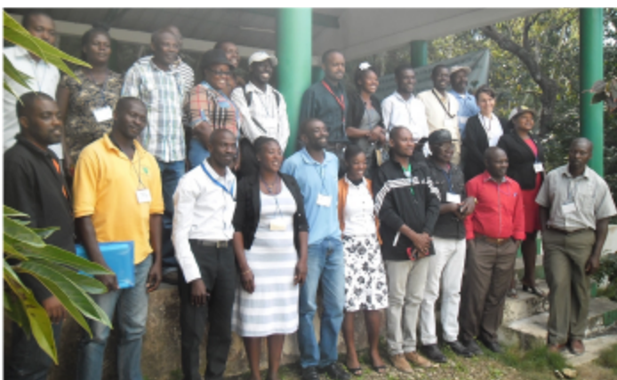
L'équipe de CESAL et des élus locaux de Fonds-Verrettes