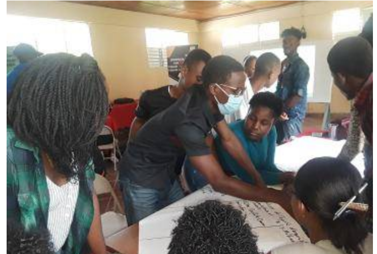
12 et 13 octobre 2021, groupe des jeunes du Centre et de l'Artibonite (Belladère, Mirebalais, Verrettes)