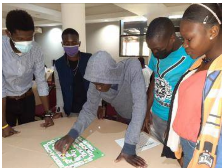
Un jeu de l'oie sur les déchets

Pour finir l'année sur une touche positive, les adolescent-es ont profité d'une excursion au bord de l'eau, dans la localité de Calebasse, à Kenscoff le 29 décembre 2021.