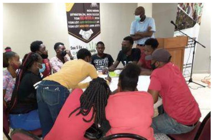
06 et 07 octobre 2021, groupe des jeunes de l'Ouest (Carrefour, Cité-Soleil, Kenscoff)