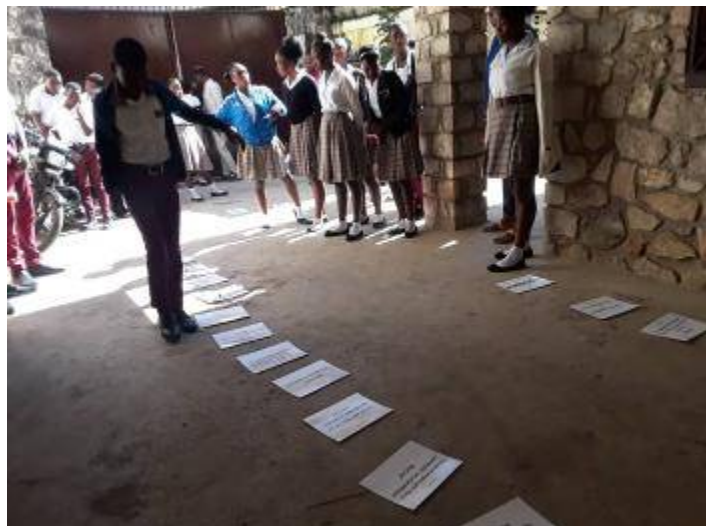
Séance d'animation à l'école Lavigne

Dans la même logique, le 1 er novembre 2021, les adolescent-es ont suivi une formation sur la manipulation des jeux produits par le GAFE autour des déchets et la biodiversité.