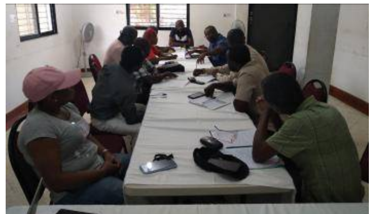
Rencontre du 14 septembre 2021 à Ouanaminthe