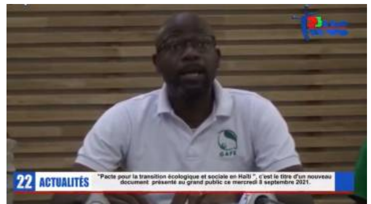
22 ACTUALITÉS "Pacte pour la transition écologique et sociale en Haïti", c'est le titre d'un nouveau document présenté au grand public ce mercredi 8 septembre 2021.