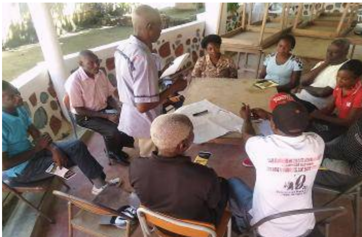
16 septembre 2021, Carice