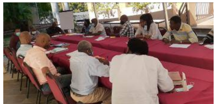
Rencontre du 10 décembre 2021 à Pétiyon-Ville