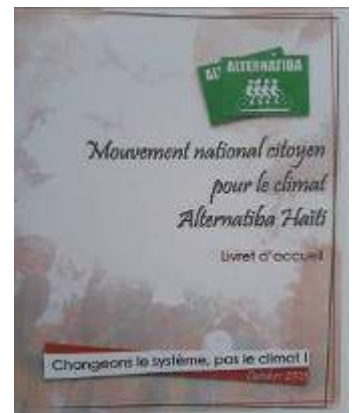
Changeons le système, pas le climat!