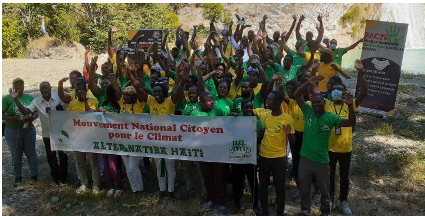
En 2018, la quatrième édition du Village des alternatives s'était clôturée à Bassin-Zim, le Village 2022 est officiellement lancé à Bassin-Zim!