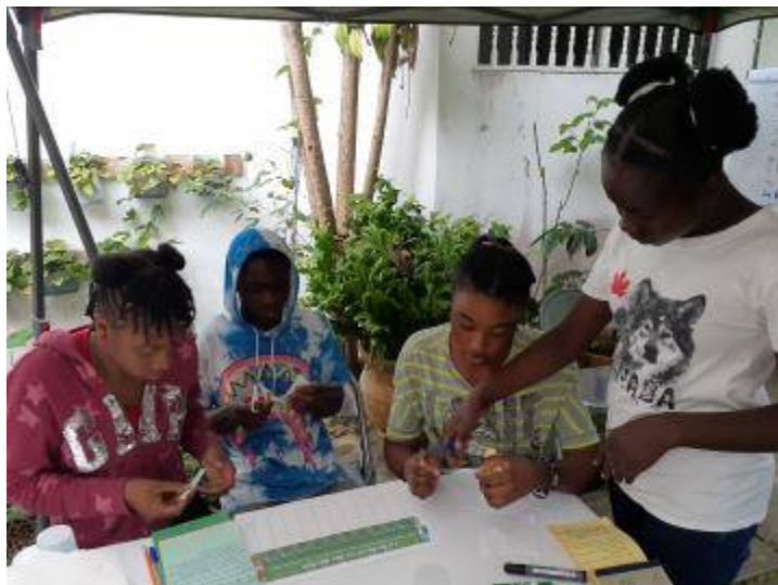
Que deviennent les déchets que je produis?

Dans la même logique, le 1 er novembre 2021, les adolescent-es ont suivi une formation sur la manipulation des jeux produits par le GAFE autour des déchets et la biodiversité.