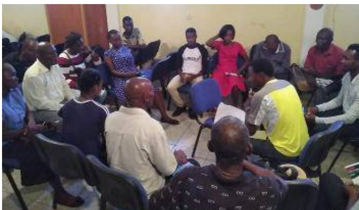
17 septembre 2021, Hinche