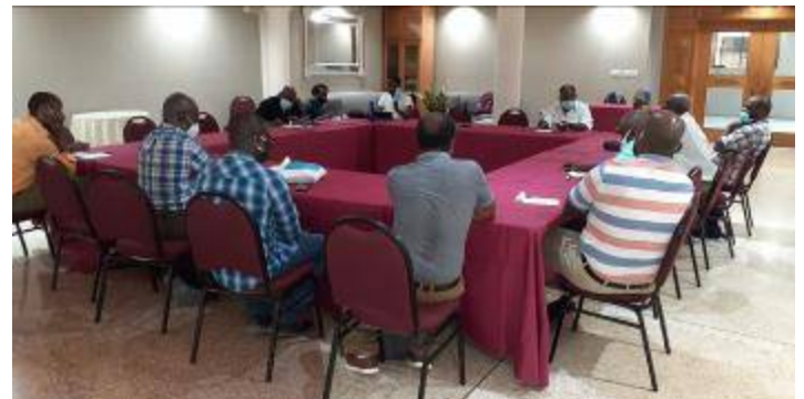
Rencontre du 03 septembre 2021 à Pétiyon-Ville

Plusieurs rencontres ont eu lieu à Port-au-Prince comme en province afin d'inviter une diversité d'organisations et décentraliser la dynamique.