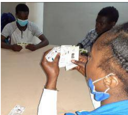
Un jeu des sept familles de déchets

S'en est suivie une formation en communication orale le 04 décembre 2021 afin de permettre aux adolescent-es d'animer des séances de jeu dans les écoles de Kenscoff pour des enfants.