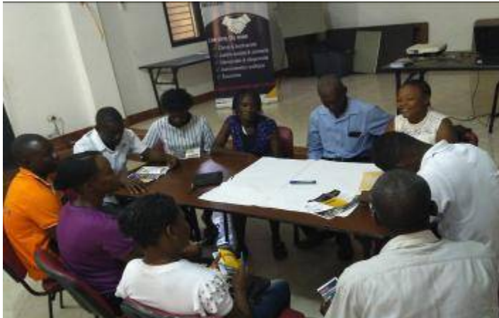
15 septembre 2021, Ouanaminthe

Les 06, 07, 12 et 13 octobre 2021, les 84 jeunes ont également été associés à la réflexion, à travers des ateliers sur le terrain.