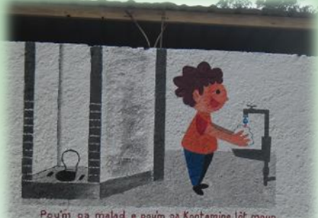
Réhabilitation du bloc sanitaire, CECLAC