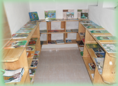
Création du centre d'informations et d'actions pour l'environnement, CECLAC