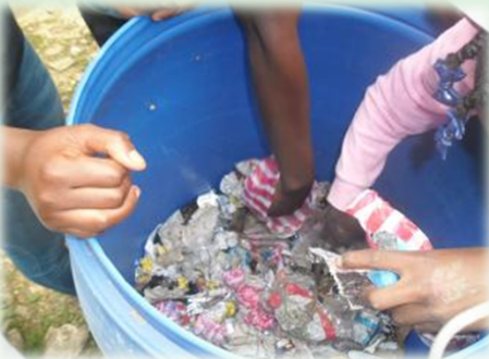
Protocole expérimental de tri des