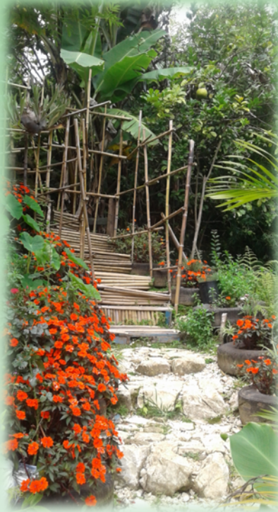
Jardin pédagogique, CCK